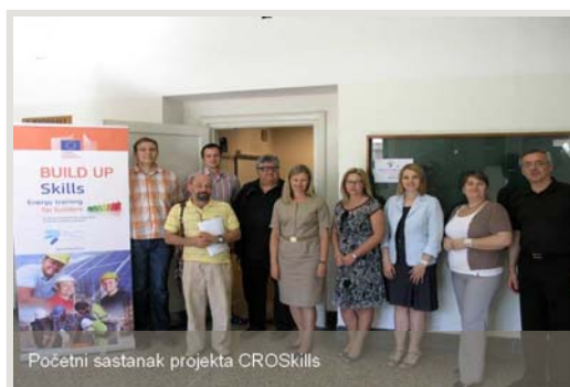
Početni sastanak projekta CROSkills